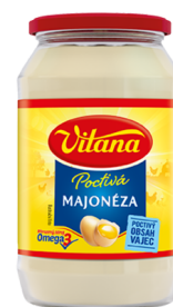
Poctivá Majonéza 225 r