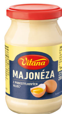
Poctivá Majonéza 225 g